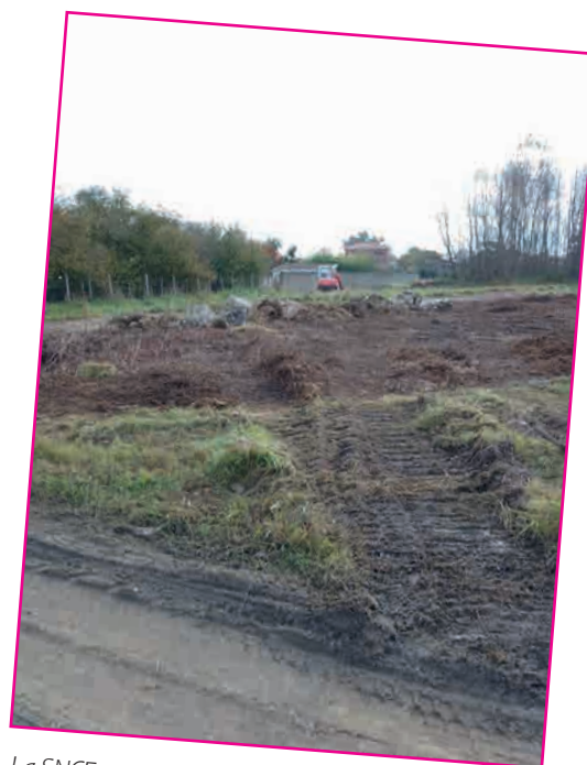
La SNCF rase vite ses parcelles et met la pression

L'association LGVEA appelle les citoyens à se mobiliser pour défendre leur cadre de vie. Rejoignez-nous lors de la prochaine assemblée générale à l'Espace Culturel Gilles Pezat de Beautiran le vendredi 24 janvier 2025, à 18h pour organiser la résistance.